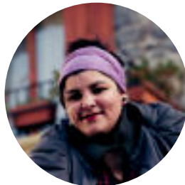
JON URBE / ARCAZ/IPSIS

Trebakuntza lortzeko bideak sustatzen ari dira orain –datorren urtetik aurrera, esaterako, for-