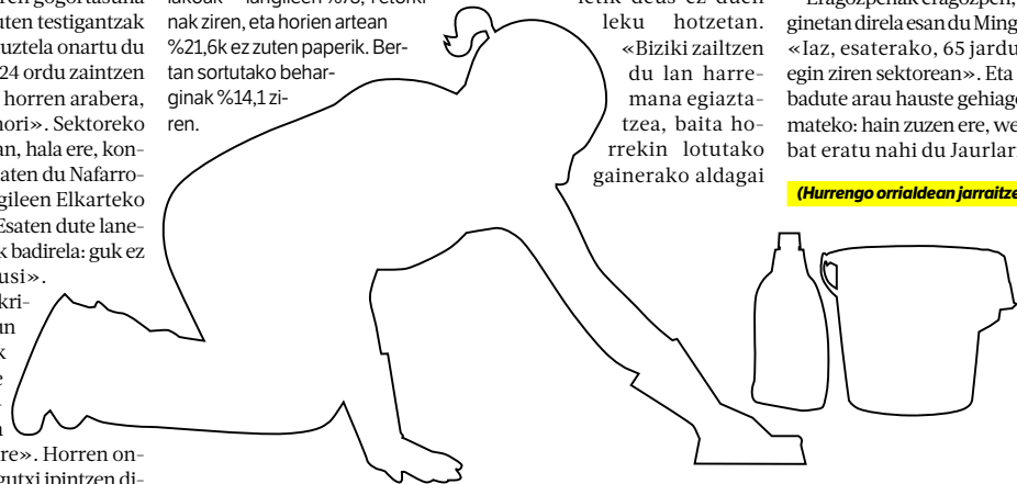
(Hurrengo orrialdean jarraitzen du)

LANGILE ETORKINEN ARTEAN PAPERIK GABEAK. ATH-ELE elkartek berriki jakinarazitako datuen arabera, haiek iaz artatutako langileen —egoiliarrek eta bestelakoak— langileen %78,4 etorkinak ziren, eta horien artean %21,6k ez zuten paperik. Bertan sortutako beharginak %14,1 ziren.